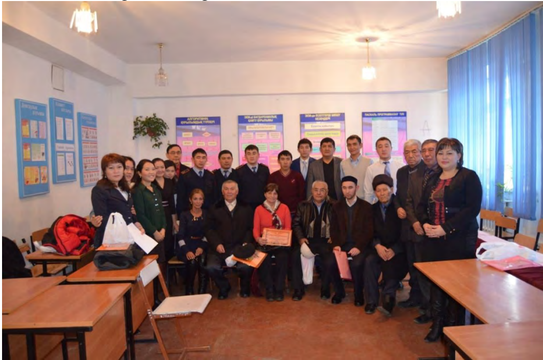
в районе имени Т.Рыскулова в с. Кайынды 21.11.2014 г.