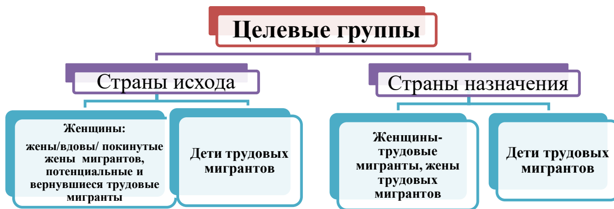
Рис. 1. Целевые группы для проведения исследования

С учетом вышеуказанных рисков, связанных с трудовой миграцией, были выделены следующие целевые группы в странах исхода: жены, вдовы и покинутые жены трудовых мигрантов; женщины, потенциальные трудовые мигранты; женщины, вернувшиеся из трудовой миграции, дети трудовых мигрантов. Что касается женской трудовой миграции в странах назначения, то были выделены целевые группы: женщины, являющиеся трудовыми мигрантами; сопровождающие трудовых мигрантов жены, дети трудовых мигрантов, находящиеся вместе с ними в стране приема.