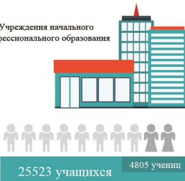
Учреждения начального профессионального образования

Уровень образования женщин, включая жен трудовых мигрантов, значительно сказывается на их экономической активности и продвижении в сфере занятости. При проведении исследования жены трудовых мигрантов (включая покинутых и вдов), а также вернувшиеся трудовые мигранты, в обсуждениях фокус-групп в обеих странах (Кыргызстан и Таджикистан) высказывались о том, что среднее образование должно стать доступным для девушек. Эксперты организаций гражданского общества и международных организаций во время интервью особо подчеркивали, что уровень выбытия девочек из учебных заведений после 9-го класса довольно высок и, как результат, гендерный пробел в профессионально-технических и высших учебных заведениях значителен. Также целевые группы и эксперты выразили обеспокоенность отсутствием возможностей профессионально-технического образования для женщин и девушек в сельской местности. Например, на конец 2016 года в учреждениях начального профессионального образования в Таджикистане обучались 25523 учащихся, из них 4805 учениц, что составляет лишь 20,7%. Здесь важное значение имеет преодоление укоренившихся социальных гендерных норм, которые придают мало значения образованию девочек, особенно после 9-го класса в старших классах среднего общего образования и при поступлении в профессиональные учреждения, техникумы и университеты. При